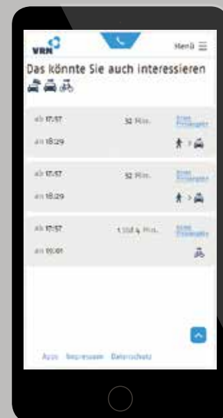
Abbildungen: Elektronische Mobilitätsauskunft des VRN