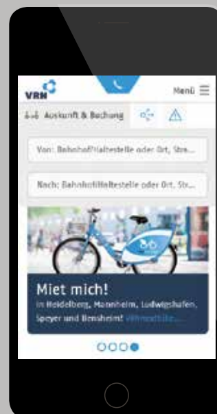
Abbildung: Mobile Version des neuen Auftritts ( www.vrn.de )

Sowohl VRNnextbike als auch die Car-Sharing-Optionen verfügen über Hintergrundsysteme, die Positionen verfügbarer Fahrräder und Fahrzeuge vorhalten und einen Zugriff aus der Mobilitätsaus-