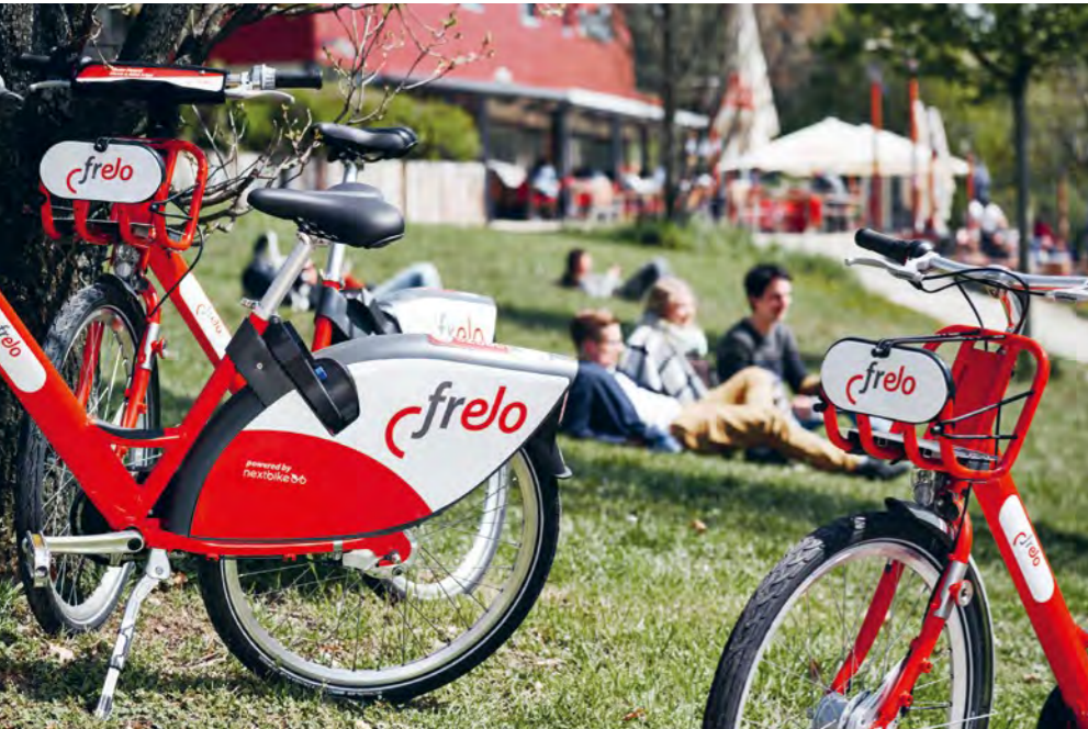
Entspannt durch den Alltag: Das Leihfahrrad bringt Menschen in Bewegung und lässt sie ihre Stadt auf ganz neue Art genießen.