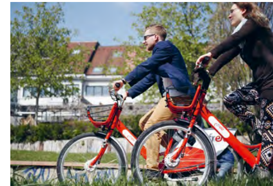
Freie Fahrt durch die Stadt: auf individuellen Routen jedes Ziel erreichen

Die besondere Stärke der VAG mobil App ist ihre Fähigkeit, auf die Services beider Anbieter im multimodalen Verkehrssystem zuzugreifen und diese Dienstleistungen zueinander in Beziehung zu setzen. Nutzer können auf diese Weise zu jedem Zeitpunkt schnell, sicher und bequem den individuell bevorzugten Beförderungsweg wählen.